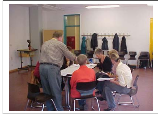
Foto: Die Teamarbeit wird in Zukunft viel öfter den Unterricht auflockern.

„Durch die neuen Methoden wird mein Unterricht abwechslungsreicher und macht mir mehr Spaß. Meine neue Rolle als Betreuer gefällt mir gut. Ich kann viel besser auf die einzelnen Schüler und ihre speziellen Probleme eingehen. Außerdem stelle ich fest, dass Schüler, die mir vorher nicht aufgefallen sind, bei dieser Art des Unterrichtens plötzlich Besonderes leisten können.“