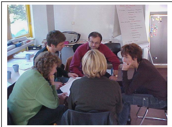
Foto: Lehrer bei der PSE-Fortbildung

In Berlin packen einige Schulen das Problem an und versuchen zusammen mit den Schülern das Problem PISA zu meistern. PSE , die Pädagogische Schulentwicklung , soll die Berliner Antwort auf PISA sein. Unser OSZ Gesundheit I ist eine von vielen Modellschulen in Berlin, an der neue Unterrichtsmethoden eingeführt werden sollen.